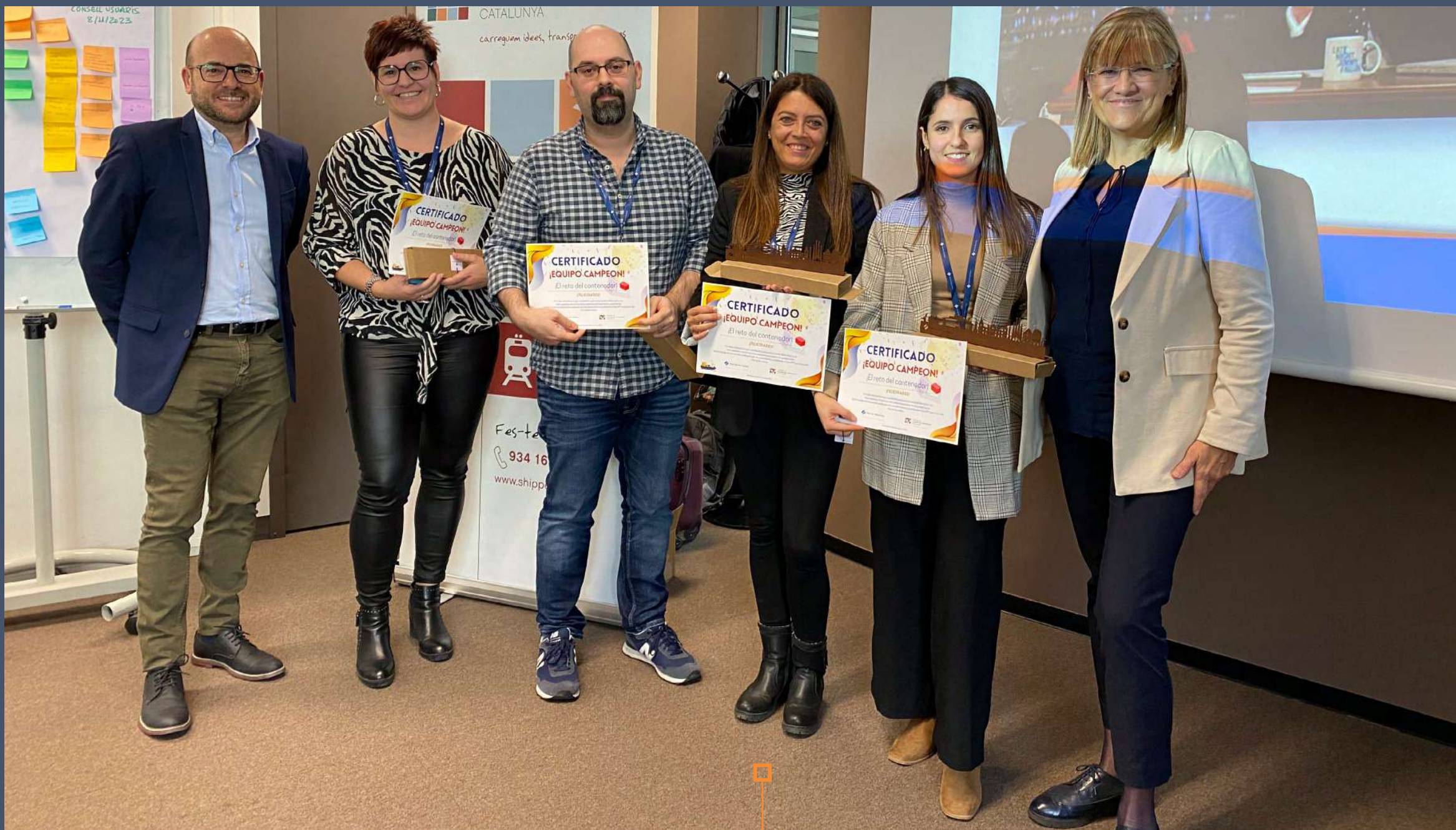
Equip Guanyador del Joc