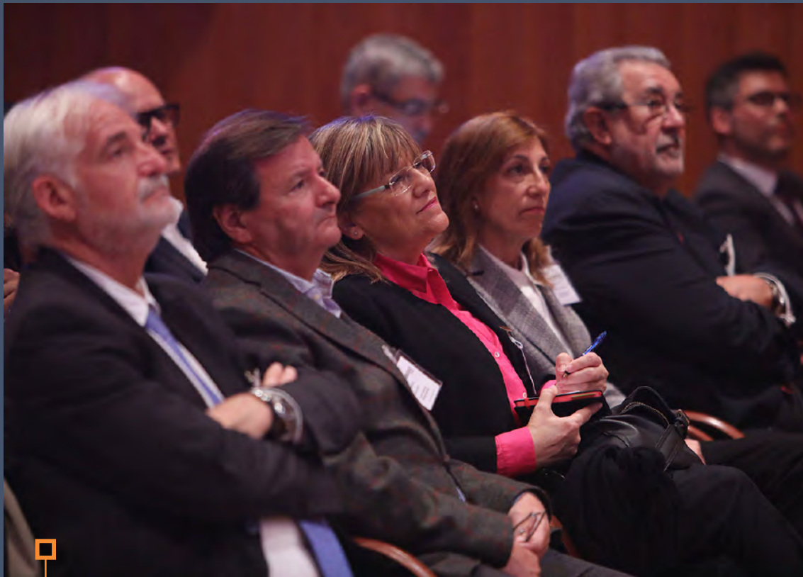
En la presentació del diari El Canal Azul