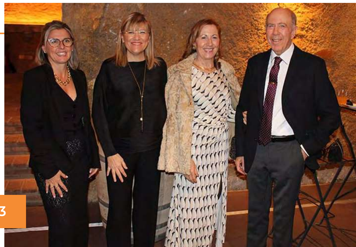
Sopar i entrega de Premis APPORTT 2023