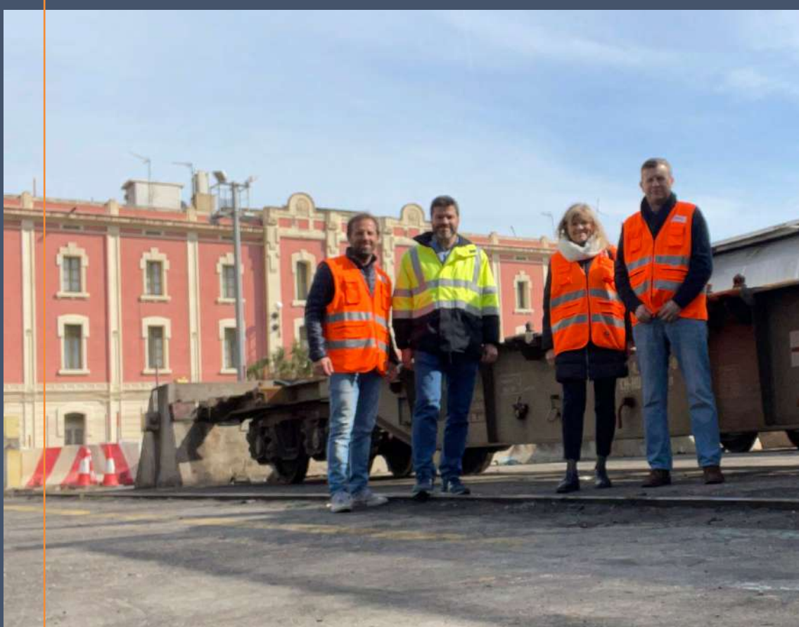
Visites a la Terminal Morrot Barcelona

Jornada gamificació sobre el pas del contenidor pel Port de Barcelona : Aquesta jornada de gamificació la repetirem en 2024.