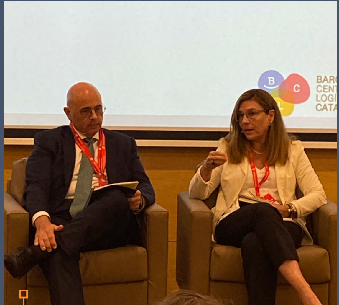
Jornada BCL en IESE