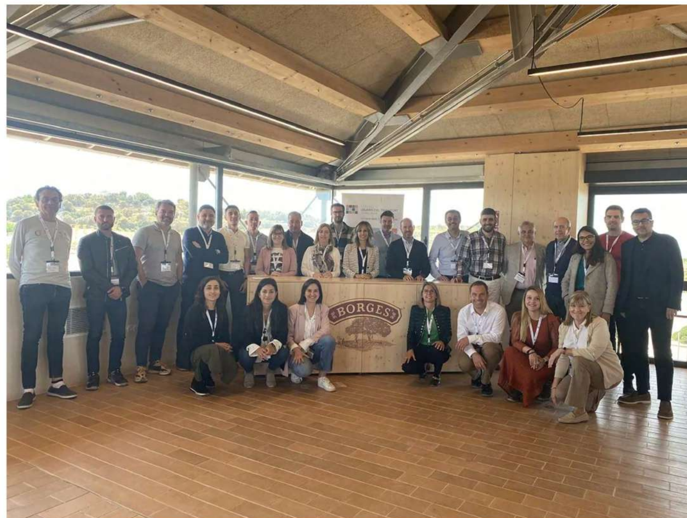
Asistentes a la Asamblea General del Consell d'Usuaris del Transport de Catalunya, celebrada en la sede de la compañía Borges